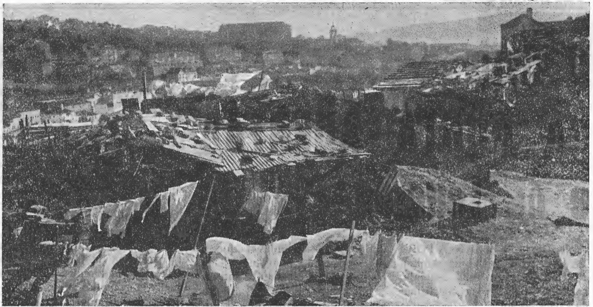
O problema angustiante da habitação fere o cerne da Nação — pois abala brutalmente a instituição familiar.

«As condições de vida dos portugueses são cada vez mais difíceis. A pobreza que se vê e a envergonhada aumentam. Não sabemos o que será o futuro. Eu estou só, como sabe, e Deus permitiu que eu tenha muito mais do que preciso para viver. A minha vida continua modesta. Não me interessa o luxo e os prazeres e aflige-me saber que há tantos trabalhadores sem receberem salários, tantas mães sem terem que dar aos filhos, enfim, tanta miséria! Depois li os livros que me têm mandado — Obra da Rua e Pão dos Pobres — e decidi que o melhor é dar já. Vós sabeis em que o aplicar. Mas,