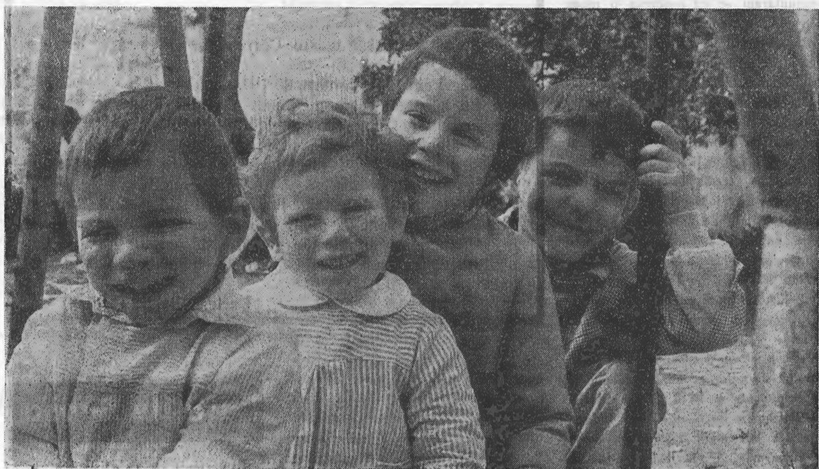
São os «Batatinhas» da Casa do Gaiato de Lisboa.